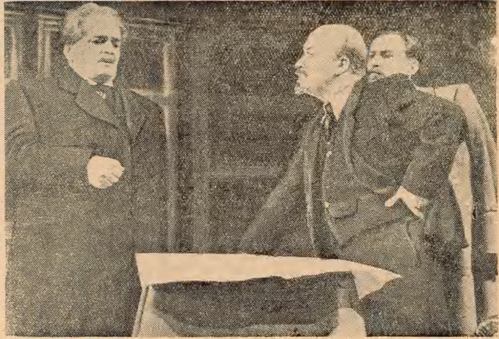
НА ЗДЫМКУ: сцэна з спектакля «Крэмлёўскія куранты». У ролі В. І. Леніна артыст П. С. Малчану.

кой (гэта была кухня і адначасова сталовае) і стаў аб усім распытваць: аб Пецярбургу, Пецярбургскім камітэце, аб тым, што робіцца ў Расіі. Якім вясной і летам 1905 г. праходзілі з'езды урачоў, настаўнікаў, адвакатаў і іншых груп інтэлігенцыі; з'езды стваралі саюзы, якія арганізаваліся ў «Саюз саюзаў». Я расказала В. І. Леніну Ільчы, як мы змагаліся з лібераламі на гэтых з'ездах і ў саюзах. В. І. Ленін Ільчы выслушаў мяне і сказаў: «Вядзецца што, вы павінны зрабіць даклад аб гэтым нашай туйтайшай рускай калоніі». Я разгубілася, паколькі ніколі не выступала з дакладамі. Але В. І. Ленін Ільчы пераканаў мяне, што даклад гэты патрэбны. У працэсе падрыхтоўкі даклада я убачыла, якім выдатным настаўнікам і таварышам быў В. І. Ленін Ільчы. Ён цярыліва ўказаваў мне на недахопы ў плане, а затым у тэзісах даклада. На сходзе ён старшыняставаў і па заканчэнню даклада зноў у некалькіх словах ўказаў мне на мае памылкі.